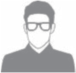
UN MAÎTRE D'APPRENTISSAGE