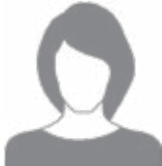
UN TUTEUR PÉDAGOGIQUE