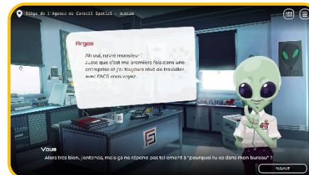
Images issues du jeu